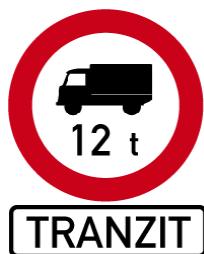
Obrázek 3 – Značka B4 s tabulkou E14

Začátek vlastního úseku se zákazem tranzitu se vyznačuje značkou B 4 „Zákaz vjezdu nákladních vozidel“ s uvedením celkové hmotnosti vozidla „12 t“ přímo do dopravní značky, pod kterou bude umístěna dodatková tabulka E 14 „TRANZIT“.